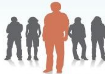
Автор: Карнаухов Олег 7 "Л"

Если у вас возникают проблемы в классе, в группе, в обществе вообще, можно обратиться за помощью к специалистам (психологам, классным руководителям, учителям). Но, кроме тебя самого, эти проблемы решить никто не сможет. Мне кажется, надо всегда и везде оставаться самим собой и учиться налаживать отношения с людьми!