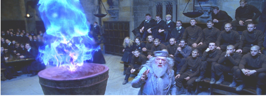
Ubi Concordia, ibi victoria «Где согласие, там победа» (лат.)

Друзья мои, поздравляю вас всех с началом учебного года, желаю вам успехов в учебе, побольше позитивных эмоций и радостных дней. Ну, и как вы догадались, с началом нового учебного года стартует так всем любимый конкурс на лучший дежурный класс «Кубок огня». Второй сезон этого соревнования был назван «В погоне за лидером», и связано это с тем, что по итогам конкурса в прошлом учебном году Кубок огня очень уверенно и с большим отрывом выиграл тогда еще 6 «б», а ныне 7 «б», и при вручении самого кубка и приза этот класс подтвердил свое намерение выиграть и следующий розыгрыш «Кубка огня». Учитывая настрой всего класса, имеющийся опыт удачного участия в Кубке огня, на старте конкурса именно 7 «б» является явным фаворитом и лидером. И кто же решится составить конкуренцию такому сопернику? Не будем забывать, что в этом учебном году 6-е классы готовы вступить в борьбу за победу в конкурсе, и, как показывает опыт, именно у средней школы шансы на победу велики. Но не будем забегать вперед, время все покажет. Продлится II сезон «Кубок огня» до 23 января