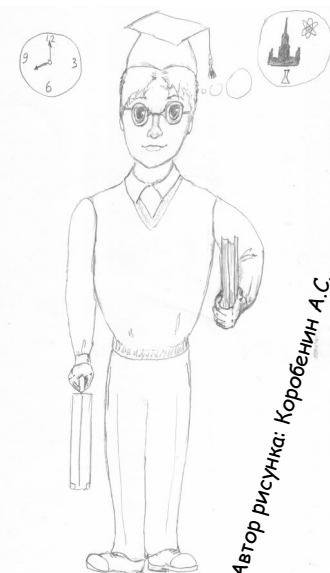
Автор рисунка: Коробенин А.С.

Это прилежный, умный, читающий ребенок. Носит школьную форму и посещает школу. Он увлечен учебой и выполняет д/з. Не имеет вредных привычек, ответственно относится к своим обязанностям и активно участвует в жизни класса. Всегда вежлив, занимается спортом и посещает кружки блока дополнительного образования. Обладает такими качествами, как честность, порядочность, смелость, целеустремленность, чувством юмора. Пунктуален во всем - не опаздывает в школу и на занятия. Знает всех своих учителей по имени-отчеству. Не кричит и не бегает по школе. Способен воспринимать информацию от учителя дистанционно.