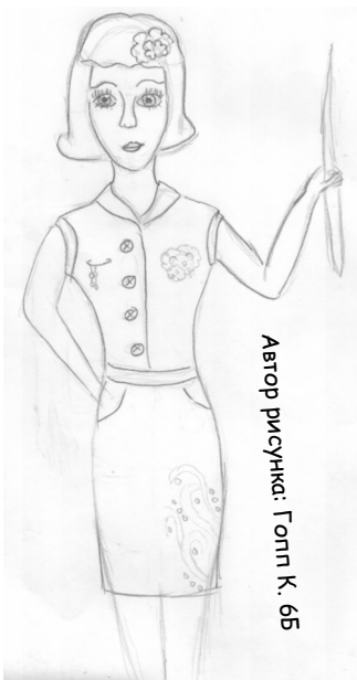
Автор рисунка: Голп К. 6Б

должен думать о детях, а не о зарплате, при этом быть богатым. Должен уметь мотивировать учащихся и не кричать. Также учитель обязан быть креативным, давать конфеты за правильные ответы, не ругать, не наказывать, а так же показывать научные фильмы на уроках. Обязательно должен быть дружелюбным и давать сказать ученикам слово на уроке. Он должен уметь интересно и понятно объяснить материал.